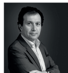
Daniel Cohen Économie Dette souveraine, crises financières, macroéconomie École d'Économie de Paris